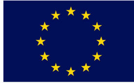
Fondo Social Europeo